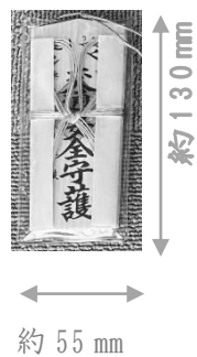
自動車交通安全木札