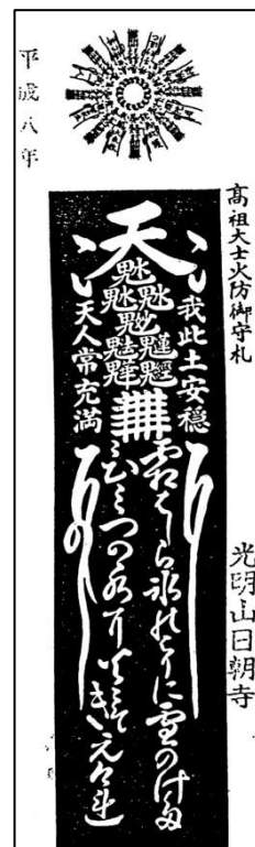
〔台所〕 火の元近くの壁面上部に貼ってください。