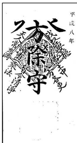
〔玄関〕 内側上部見返しに貼ってください。